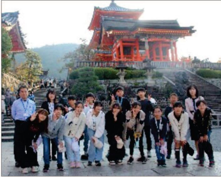
清水寺で記念写真をとる6年生

最近あちこちの学校ではインフルエンザ等で学級閉鎖が相次いでいたのでも心配なるとても心配していましたが、当