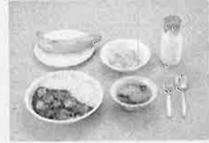
【昭和52年頃】 カレーライス、牛乳 塩もみ（野菜）、スープ 果物