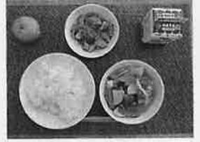
【現在】 和食が中心で、地元の食材を 活用し、食育の視点を踏まえた 献立内容です。