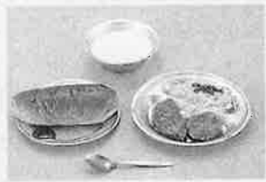
【昭和27年頃】 コップパン、ミルク（脱脂粉乳） 鯨肉の竜田揚げ、せん切りキャベツ、 ジャム