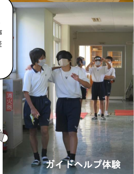
ガイドヘルプ体験