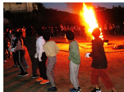
【キャンプファイヤー】