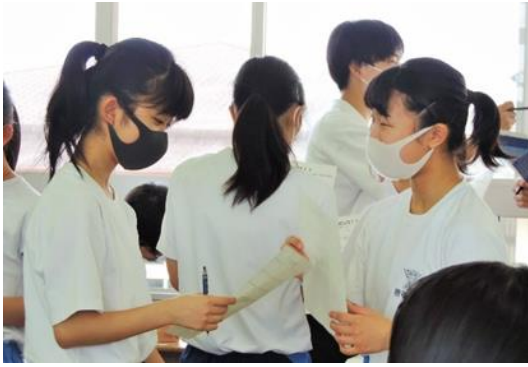
▲ 中部中タイム（エンカウンター）より

昨年度末からの約三か月に及ぶ臨時休業が明け、六月から通常登校となりました。学校に主役が戻り、毎日、生徒たちの元気な笑い声や活動の息吹を感じてほっとしています。