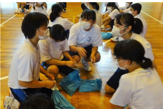
▲ 生徒会活動「団交流」より

「学校の新しい生活様式」の中で、学校でしか味わえない魅力ある中部中の教育を進めるにあたり、校区の皆様のご理解とご支援をお願いいたします。