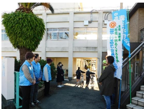
▲ 健全育成会挨拶運動

中部中学校の教育活動や学校運営について、年二回の会議でアドバイスをいただきます。また、年度末に学校関係者評価をしていただきます。