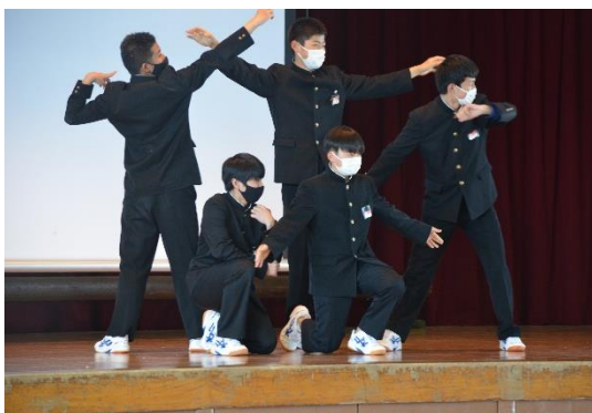
▲ 生徒会活動「団発足会」より

例年どおりとなりつつある「学校の新しい生活様式」の中で、学校でしか味わえない魅力ある中部中の教育を進めるうえで、校区の皆様のご理解とご支援をお願いいたします。