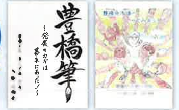
第8回小学生の部(優秀賞)